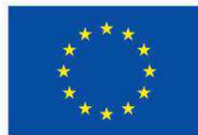
UNIÓN EUROPEA FONDO DE ASILO, MIGRACIÓN E INTEGRACIÓN Por una Europa plural