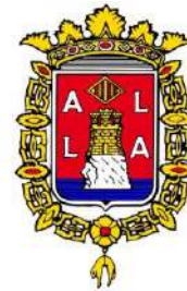
AYUNTAMIENTO DE ALICANTE Concejalía de Acción Social