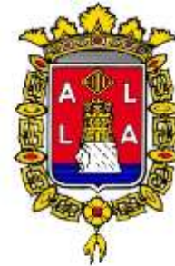
AYUNTAMIENTO DE ALICANTE Concejalía de Acción Social